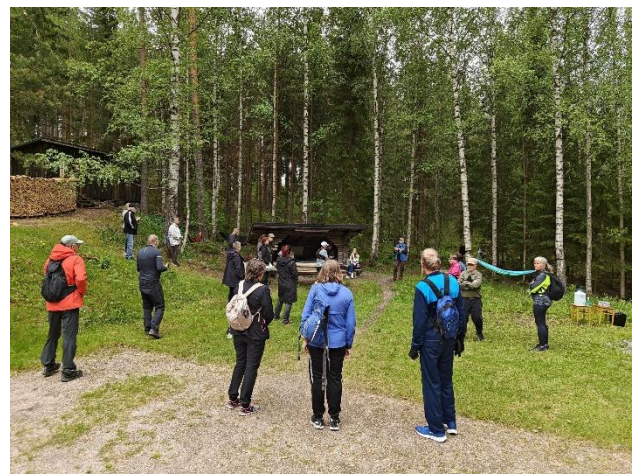
Kuvat 18.-19. Retkelle-päivän tapahtuma: Latumajan luontopolun avajaiset