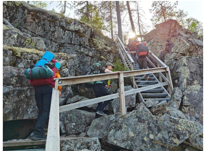
Kuvat 7.-8. Kahden yön telttaretki Tiilikkajärven ja Hiidenportin kansallispuistoihin