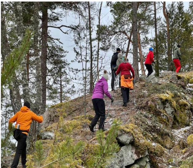
Kuva 4. Pitkä kävely Tarinmaalla

Pitkän kävelyn harjoitukset aloitettiin huhtikuussa. Pitkissä kävelyissä kävellään n. 20 km:n matka reipasta n. 5 km/h vauhtia pitäen. Keväällä käveltiin 3 kertaa ja syksyllä 6 kertaa. Osallistumisia oli yhteensä 50. Pitkiä kävelyjä järjestettiin Tarinmaalla, Kalpalinnassa, Puhinniemessä, Tervakosken Huistissa, Loimalahden ja Ahvenisto maastoissa sekä Isojärven ja Saloistenjärven ympäri. Pitkiin kävelyihin voidaan lukea mukaan myös osallistuminen Lopella Poronpolku-tapahtumaan 5.10.2025 ja Riihimäellä Riihipolku-tapahtumaan 5.10.2025. Pitkissä kävelyissä ohjaajina olivat Päivi Kuotola, Tiina Hiidenkari, Päivi Waldén, Mikko Pirilä ja Mikko Helenius. Tosi pitkän kävelyn reittinä oli Turenki-Kolmilammi-Turenki, matkaa tuli 29,5 km, osallistujia oli 9. Tosi pitkän kävelyn ohjasi Mikko Helenius.