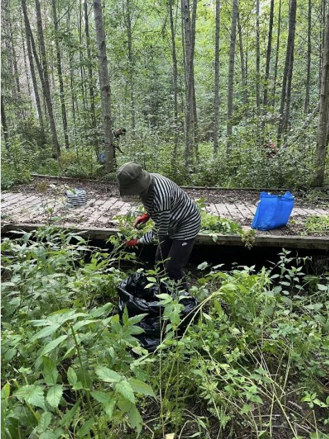
Kuva 20. Jättipalsamin torjuntatalloissa

Sauna- ja jäsenilta Mallinkaisten leirikeskuksesta järjestettiin kesäkauden loppuksi 1.9.2025 Mallinkaisten leirikeskuksesta saunoen, uiden, eväitä syöden ja nuotiolla istuskellen. Osallistujia oli 18 henkilöä.