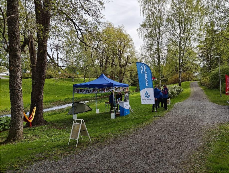
Kuva 23. Turengin Kevätkarkelot Lyylinpuistossa

Janakkalan Luonto ja Ympäristön ja Janakkalan kunnan yhteistyössä järjestämään Laurinmäen luontotapahtumaan 8.6.2025 osallistui Janakkalan Ladulta yksi talkoolainen pitämällä tapahtumassa Hyvän mielen metsäpolkua. Hyvän mielen metsäpolulla oli omatoimisesti tehtäviä luonnon hyvinvointivaikutuksiin ja aistielämyksiin liittyviä tehtävärasteja.