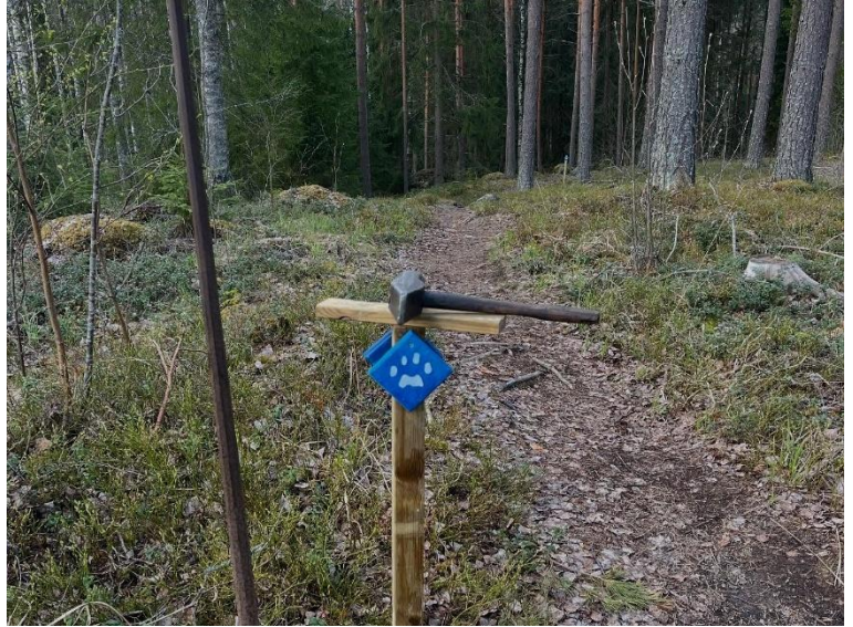
Kuva 15.-16. Luontopolun talkootöitä