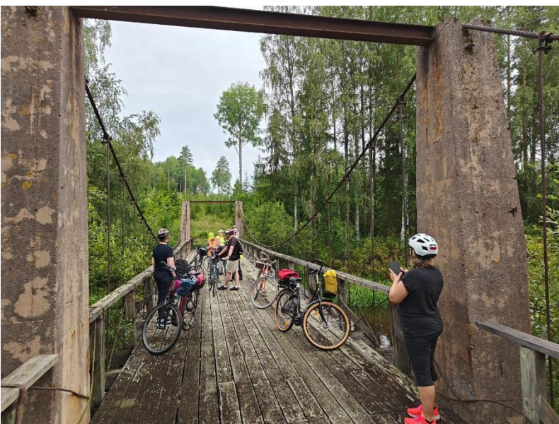
Kuva 9. Maisemapyöräily