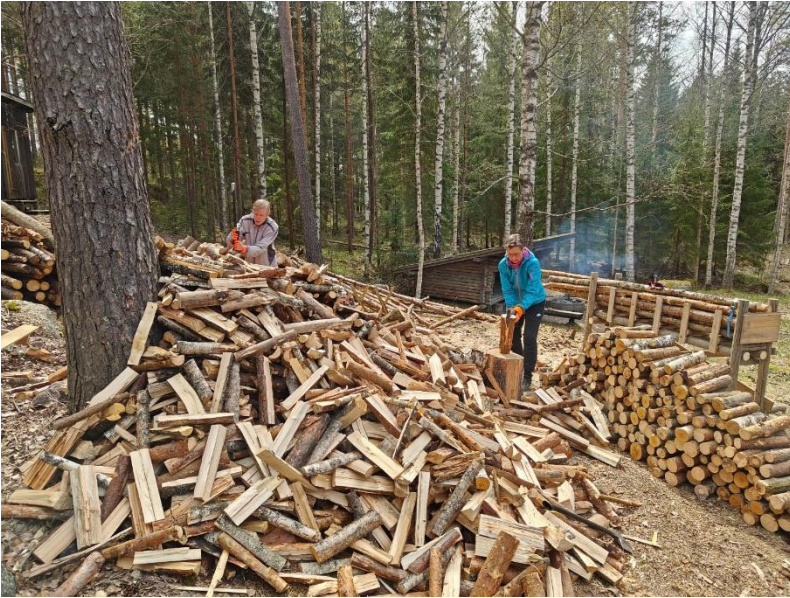
Kuva 17. Polttopuiden tekoa talkoissa

Retkelle-päivänä 7.6.2025 järjestettiin Latumajan luontopolun avajaistapahtuma. Latumajalla kävi päivän aikana n. 100 vierailijaa. Majalla pääsi mm. osallistumaan Arvaa nauhan pituus -kilpailuun, nukkumaan päiväunia ulkona ja luontobingoilemaan. Janakkalan Latu tarjosi ja Tanttalan kylän ja koulun tuki ry paistoi ja tarjoili majalla makkaraa, lettuja, kahvia ja mehua. Maantietä pitkin Turengista Latumajalle pyöräili ohjatussa ryhmässä 4 henkilöä 12 km. Kukin ajeli oman aikataulun mukaan takaisin. Maastopyörillä harjuja pitkin saapui ohjatussa sähköavusteisten pyörien ryhmässä 3 ja luomupyörien ryhmässä yhteensä 6 henkilöä. Heille kilometrejä tuli edestakaisin reilut 23 km. Luontopolkuun pääsi tutustumaan omatoimisesti tai ohjatusti. Ohjatussa polkujuoksussa oli 2 henkilöä ja ohjatulla kävelykierroksella oli mukana yhteensä 21 henkilöä, joista osa käveli koko 5 km:n kierroksen ja osa vähän lyhyemmän. Avajaistapahtuman järjestäjinä, eri lajien ohjaajina ja esittelypisteellä olivat Terhi Toikka, Maria Svetloff, Kaisa Jetsu, Harri Niemi, Markku Lönnqvist, Arto Mykkänen, Raija Tauru ja Tiina Elovaara.