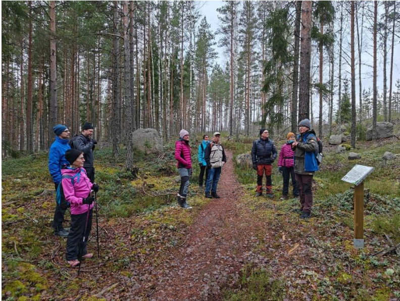
Kuva 3. Glögiretki Latumajan luontopolulla