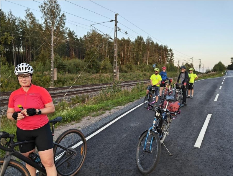
Kuva 10. Torstaipyöräily