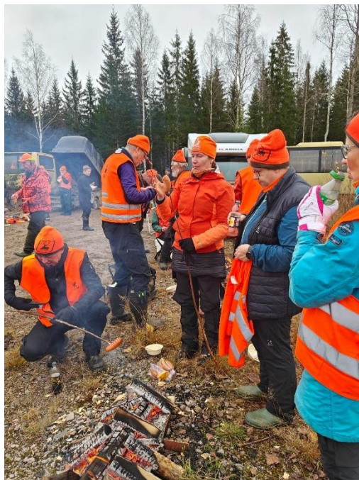
Kuvat 21.-22. Hirvijahdissa