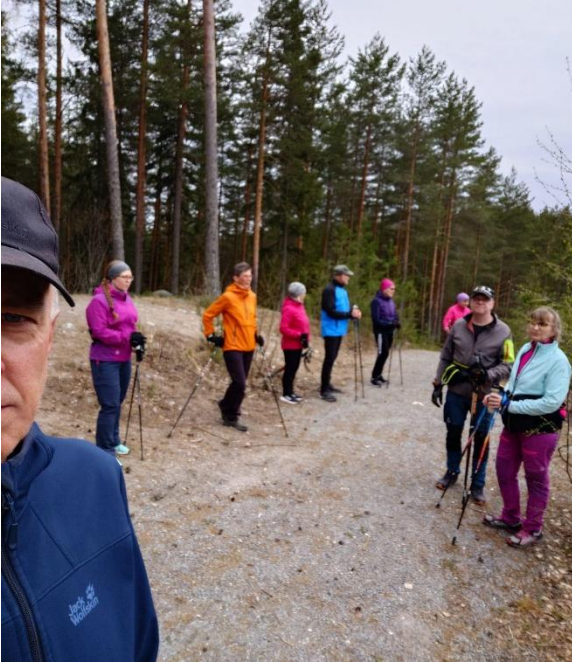
Kuva 5. Sauvakävelijät