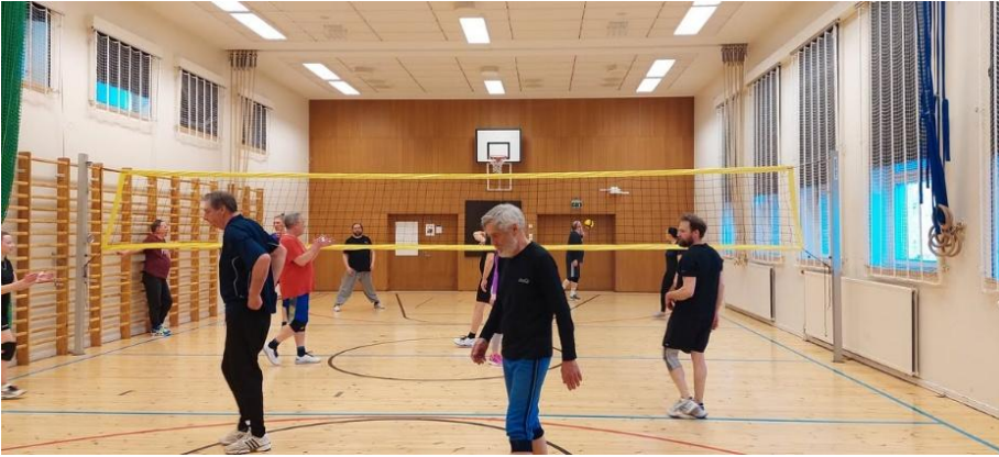
Kuva 1. Lentopalloilua Leppäkosken koulun salissa