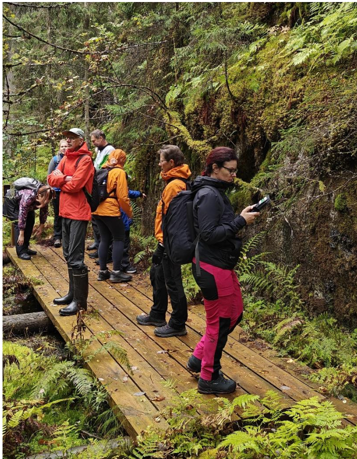
Kuva Evon majavaretkeltä.

Jo toista vuotta suosiossa olleet retkikävelyt jatkuvat vielä Glögiretkellä la 21.12. Latumajalla klo 10.00 (Glögin lisäksi piparia tarjolla).